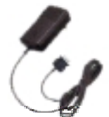
Cargador rápido de viaje Clave NPN6197