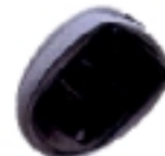
Cargador de escritorio dual Clave NTN8653