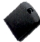
Batería delgada de Litio Clave NTN8615