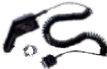
Cargador Vehicular Clave NTN8655