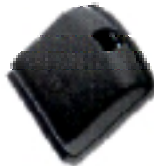
Batería Estándar Clave NTN8614