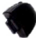
Adaptador de Audio Clave NTN8654